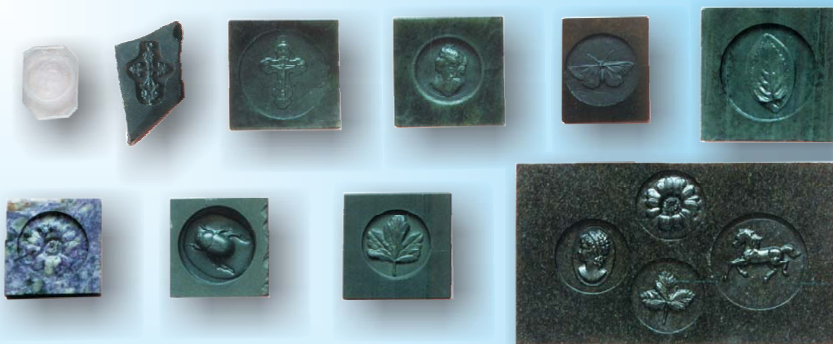
Образцы изделий из различных материалов